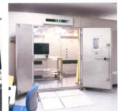
恒温恒湿室 (タバイエスペック TBL-6HA4G2A4C)