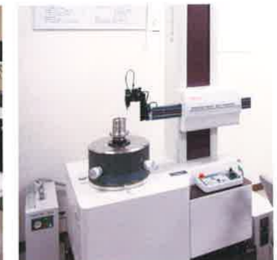
真円度測定機 (ミツトヨ RA-5200AH)