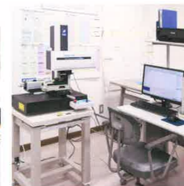
表面形状・粗さ測定機 (東京精密 サーフコム 1900-SD3)