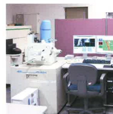
電子顕微鏡 (日本電子 JSM-6610LA)