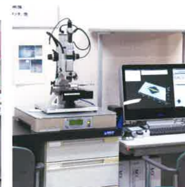
デジタルマイクロSCOPE (ハイロックス KH-8700)