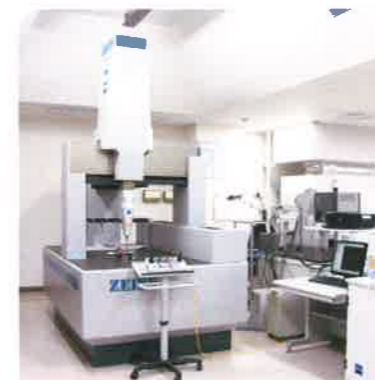
三次元座標測定機 (カールツァイス UPMC850 S-ACC CARAT)